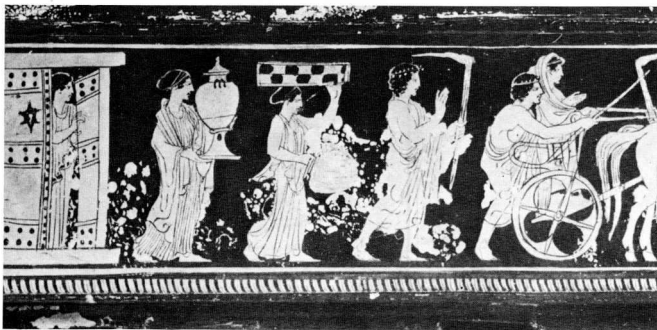
Πομπή γάμου από ερυθρόμορφη πυξίδα 5ος αι. π.Χ. Η νύφη οδηγείται στο νέο σπίτι της.