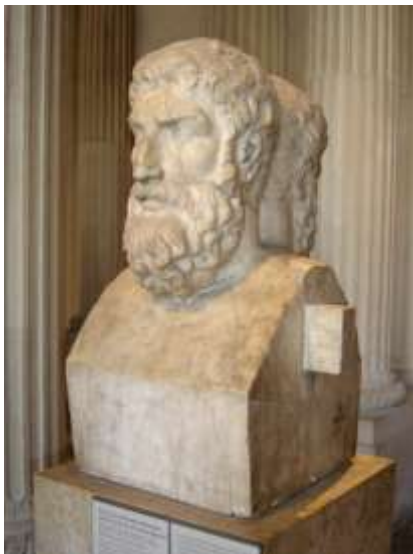
Προτομή του Επίκουρου (Μουσείο Λούβρου)

« Μη σε στενοχωρεί ο θάνατος ». Όσο είσαι ζωντανός, δεν έχεις σχέση μ' αυτόν· μα κι όταν πεθάνεις, πάλι δεν έχεις να κάνεις μ' αυτόν, διότι τότε δε θα 'χεις να κάνεις με τίποτα. «Ένα τίποτα είναι για μας ο θάνατος», λέει ο Επίκουρος, γιατί «όταν υπάρχουμε εμείς, ο θάνατος είναι απών, και όταν ο θάνατος είναι παρών, δεν υπάρχουμε εμείς». — Επίκουρου επιστολή προς Μενοικέα 125 (βλ. σελίδα 255 του βιβλίου) Ο θάνατος είναι πάντοτε άσχετος μ' εμάς, αν και προκαλεί μεγάλη στενοχώρια σε πολλούς ανθρώπους για μεγάλο διάστημα της ζωής τους. Η έγνοια του θανάτου καλύπτει σαν πέπλο την εμπειρία της ζωής, είτε γιατί οι άνθρωποι προσβλέπουν σε μετά θάνατο ζωή και τρομοκρατούνται και ε-